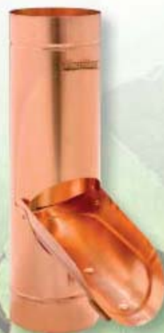
Odvádzač vody so záklopkou a sitom na listie

25 / 480 25x5 33 / 480 25x5 33 / 550 25x5