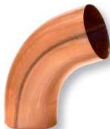
Koleno - lisované

72° zvarané 80 / 72° (40°) 100 / 72° (40°) 120 / 72° (40°)