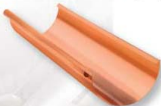
Žľab pododkvapový - polkruhový