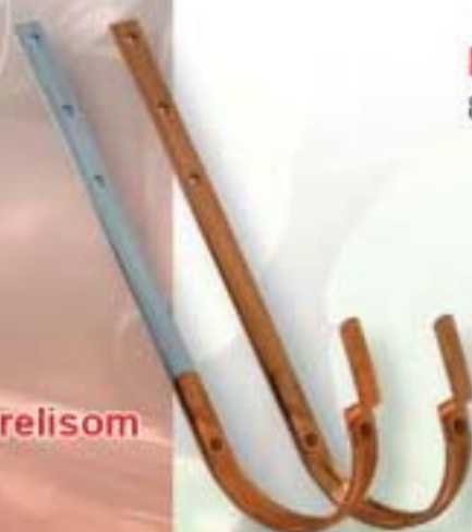
Žľabový hák s prelisom

25 / 415 25x4 25 / 440 25x4 25 / 485 25x4 28 / 485 25x5 (30x5) 28 / 510 25x5 (30x5) 28 / 540 25x5 (30x5) 33 / 480 25x5 (30x5) 33 / 510 25x5 (30x5) 33 / 550 25x5 (30x5) 33 / 610 25x5 (30x5) 33 / 550 (30x5) 33 / 650 (30x5)