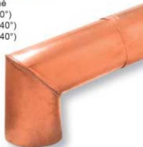
Koleno S - cinované